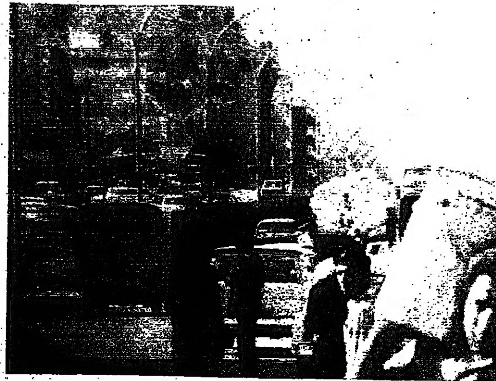
حركة سير وشاحنة حزين نسي كورنيش المزرعة